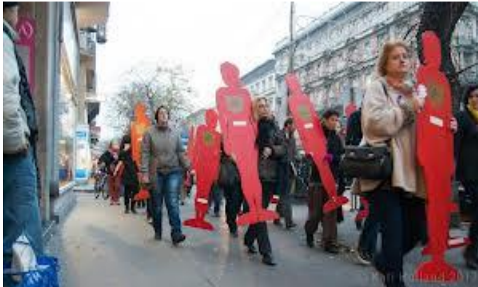
Néma Tanúk felvonulás, 2012. nov.